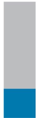
Axillary Lymph Node Dissection