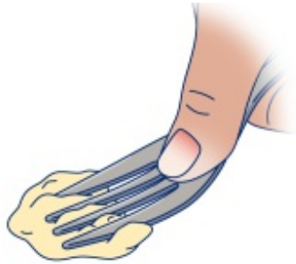
الشكل 3. اختبار الضغط بالشوكة

ضع الشوكة على طعامك. اضغط بإصبع الإبهام على الشوكة (انظر الشكل 3). يكون الطعام لينًا بما يكفي إذا تم سحقه تمامًا ولم يرجع إلى شكله الأصلي.