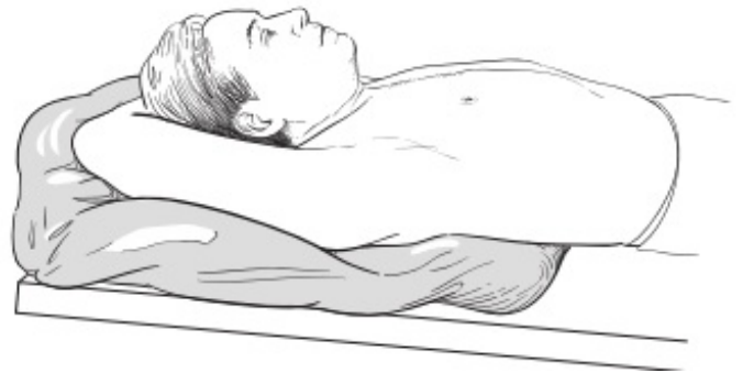
الشكل 1. تحديد الوضعية في القالب

سوف تستلقي على ظهرك على الأرجح أثناء المحاكاة. وأثناء استلقاءك على الطاولة، سيتم إنشاء قالب للجزء العلوي من جسمك. سيُصَب المعالجون الإشعاعيون سائلاً دافئاً داخل كيس بلاستيكي كبير يتم إغلاقه بإحكام ووضعه على الطاولة. وستستلقي فوق الكيس على ظهرك مع رفع يديك فوق رأسك (انظر الشكل 1). ستشعر بدفء السائل في البداية، ولكنه سيصبح أكثر برودة عندما يتصلب. وفيه يبرد السائل، سيلصق