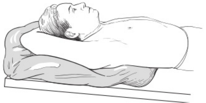
الشكل 1. تحديد الوضعية في القالب

سوف تستلقي على ظهرك على الأرجح أثناء المحاكاة. وأثناء استلقائك على الطاولة، سيتم إنشاء قالب للجزء العلوي من جسمك. سيصُب المعالجون الإشعاعيون سائلاً دافئاً داخل كيس بلاستيكي كبير يتم إغلاقه بإحكام ووضعه على الطاولة. وستستلقي فوق الكيس على ظهرك مع رفع يديك فوق رأسك (انظر الشكل 1). ستشعر بدفء السائل في البداية، ولكنه سيصبح أكثر برودة عندما يتصلب. وفيما يبرد السائل، سيلصق المعالجون