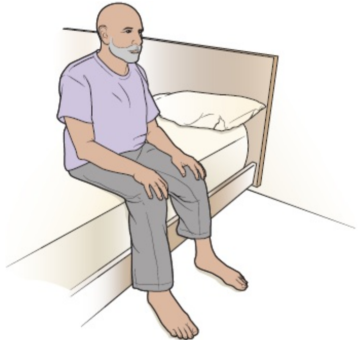
Abbildung 3. Sitzen auf dem Bettrand