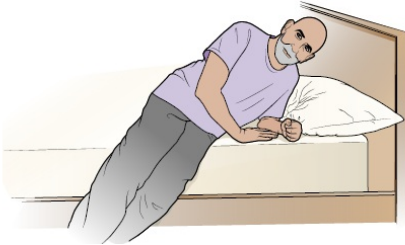
Abbildung 2. Verwenden der Arme zur Unterstützung beim Aufsetzen

sicher, dass Sie Ihre Arme dabei eng am Körper halten.