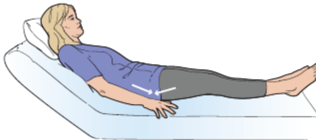
Εικόνα 4. Σετ για τους γλουτούς