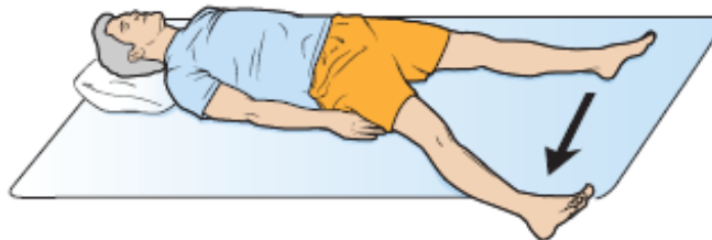
Εικόνα 5. Ενίσχυση απαγωγών