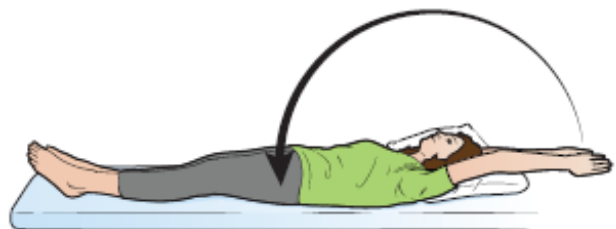
Εικόνα 11. Τεντωμένα χέρια πάνω από το κεφάλι