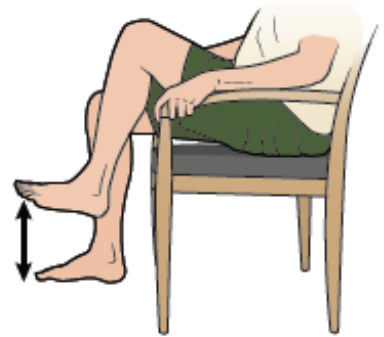
Εικόνα 15. Στατικό βάδισμα