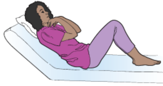
Εικόνα 9. Αγγίζοντας τους ώμους σας