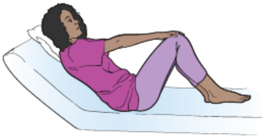
Εικόνα 8. Τεντώνοντας τα χέρια σας προς τα έξω