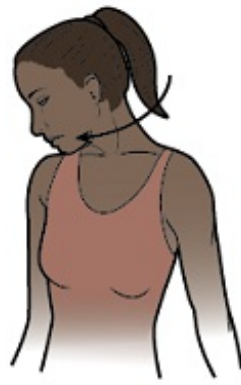
Εικόνα 3. Κινήστε το κεφάλι σας ώστε η μύτη να δείχνει προς τη μασχάλη