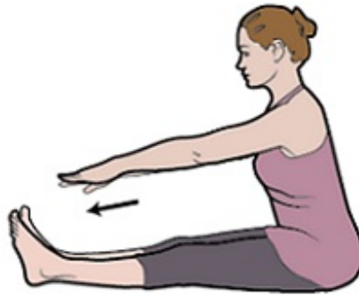
Εικόνα 7. Διάταση ιγνυακού τένοντα