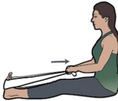
Εικόνα 8. Διάταση κνήμης σε καθιστή θέση