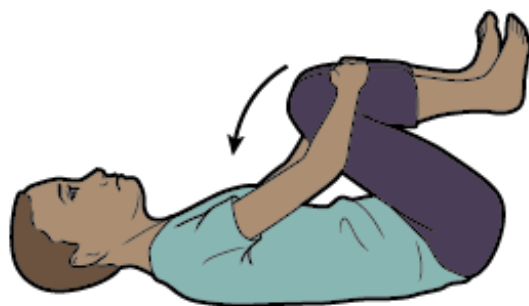
Εικόνα 6. Διάταση γόνατος προς το στήθος