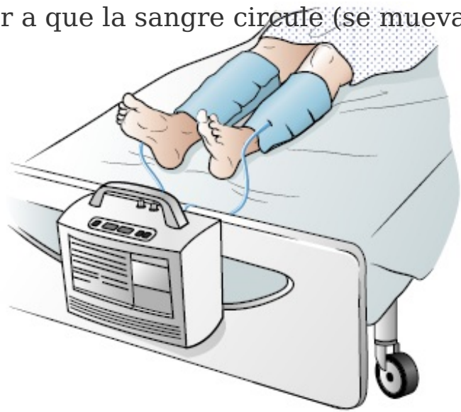
Figura 3. Mangas del SCD en las piernas

Siempre debe usar las mangas del SCD cuando esté en la cama del hospital, a menos que su proveedor de cuidados de la salud le indique que no lo haga. Asegúrese de quitárselas antes de levantarse de la cama, ya que podría tropezarse con la sonda y caerse. Si nota que la sonda está apretada o que la bomba emite un pitido, dígaselo al proveedor de cuidados de la salud.