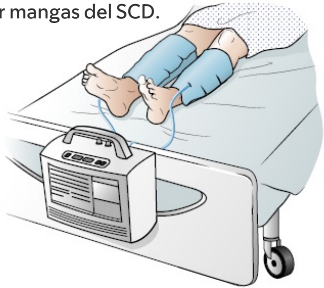
Figura 3. Mangas del SCD en las piernas

Las mangas del SCD se colocan alrededor de la parte inferior de las piernas (véase la figura 3). Se conectan por medio de sondas a una máquina que sopla y aspira aire de ellas para apretarle las piernas con suavidad. Esa es una manera segura y eficaz de ayudar a que la sangre circule (se mueva) para prevenir coágulos.