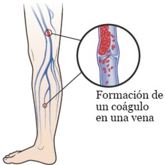
Trombosis venosa profunda (DVT) de la pierna