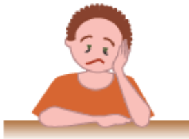
Debilidad o mucho cansancio