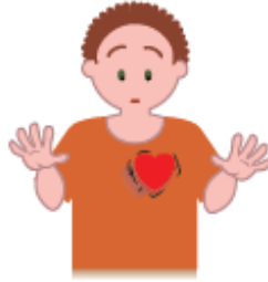
Ritmo cardíaco rápido