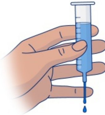
Figura 3. Retire el dedo de la punta de la jeringa