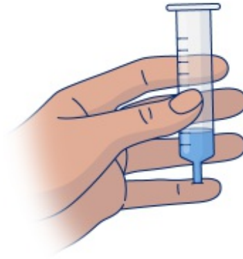
Figura 4. Cubra la punta de la jeringa después de 10 segundos