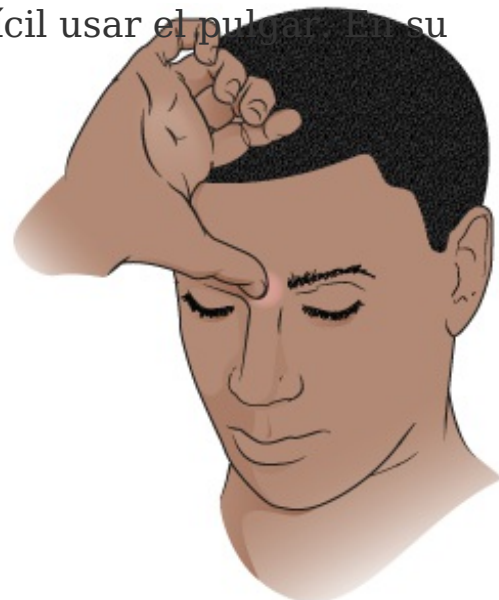
Figura 2. Colocación del pulgar entre las cejas

Puede hacer acupresión sobre este punto varias veces al día hasta que sus síntomas mejoren.