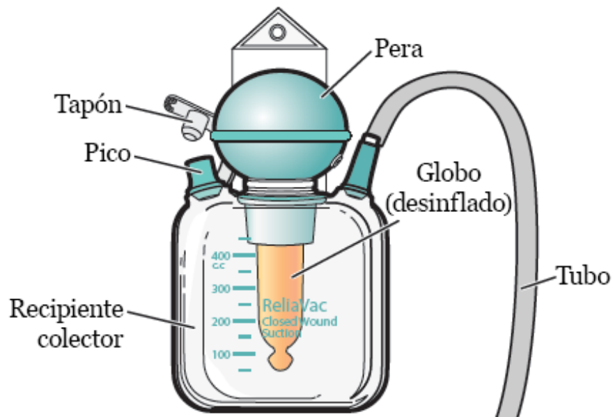
Figura 1. Drenaje ReliaVac

Cuando el globo dentro del recipiente de recolección se infla (se llena), crea una succión constante y suave (véase la figura 2). Esta succión ayuda a extraer el líquido que se acumula debajo de su incisión. El globo siempre debe estar inflado, excepto cuando esté vaciando su drenaje, a menos que su proveedor de cuidados de la salud le indique lo contrario.