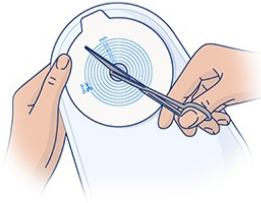
Figura 5. Corte del disco para un sistema de bolsa de 1 pieza