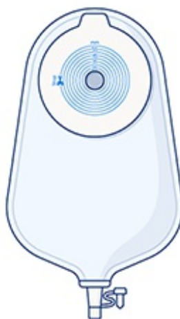
Figura 3. La bolsa y el disco unidos en un sistema de bolsa de 1 pieza