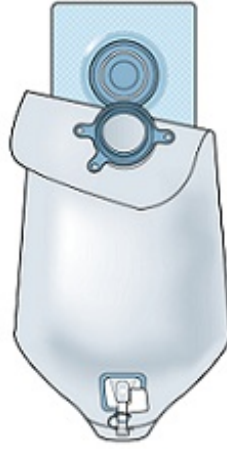
Figura 2. Ajuste de la bolsa al disco para un sistema de bolsa de 2 piezas