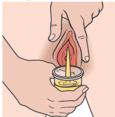
Figura 3. Orinar en el recipiente para la orina