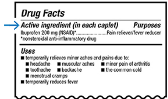
Figura 1. Ingredientes activos en la etiqueta de un medicamento sin receta

medicamentos con receta enumeran sus ingredientes activos en la etiqueta. El nombre de los ingredientes activos es el mismo que el del medicamento genérico.