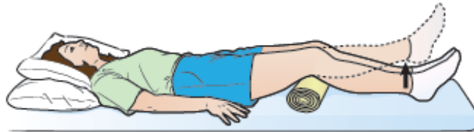
Figura 2. Cuádriceps de arco corto