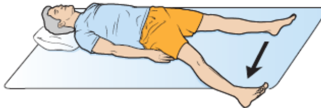
Figura 5. Fortalecimiento de los músculos abductores