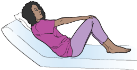
Figura 8. Estirar los brazos