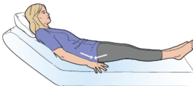
Figura 4. Series de glúteos