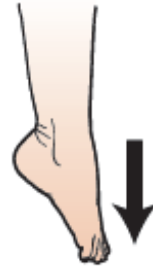
Figura 14. Apuntar con los dedos de los pies hacia abajo