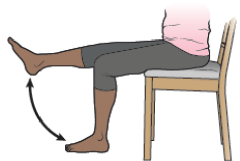
Figura 16. Patear hacia adelante