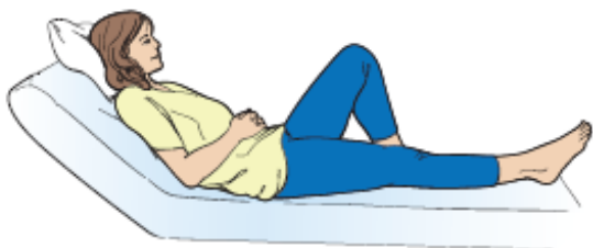
Figura 6. Doblar la pierna