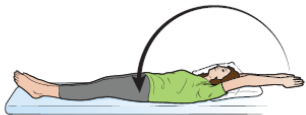
Figura 11. Estiramiento de brazos por encima de la cabeza