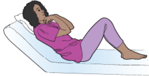
Figura 9. Tocarse los hombros