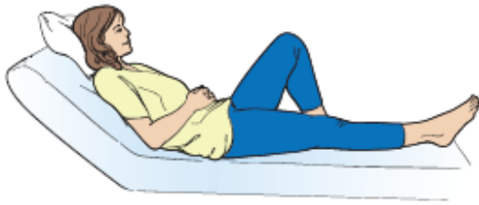
Figura 6. Doblar la pierna