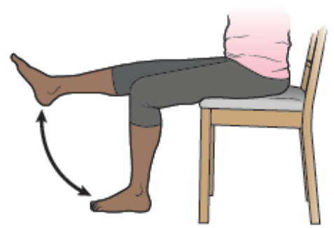
Figura 16. Patear hacia adelante