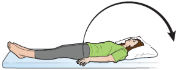
Figura 10. Brazos a los costados