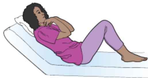
Figura 9. Tocarse los hombros