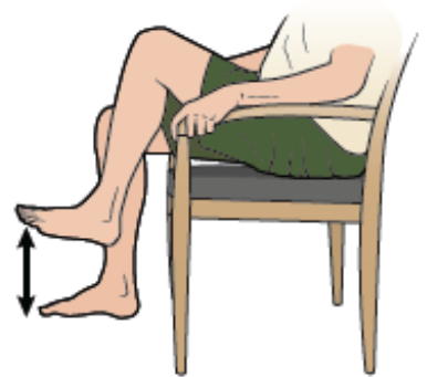
Figura 15. Marchar en el mismo lugar