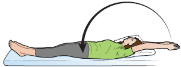
Figura 11. Estiramiento de brazos por encima de la cabeza