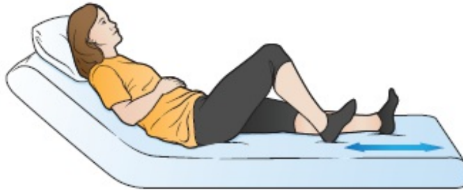
Figura 1. Deslizamiento de talón