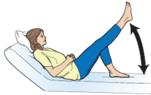
Figura 7. Levantar la pierna