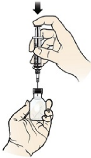
Figura 3. Inyección del líquido de dilución en el frasco de glucagón