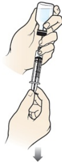
Figura 5. Rellene la jeringa con la mezcla de glucagón

Jale el émbolo de la jeringa con suavidad para llenarla con el medicamento en el frasco. Si hay aire en la parte superior de la jeringa, debe empujar suavemente el émbolo para quitarlo.