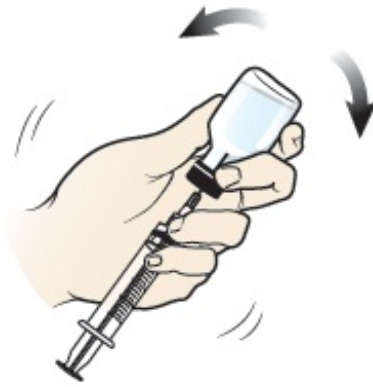
Figura 4. Mezcle el polvo de glucagón con el líquido