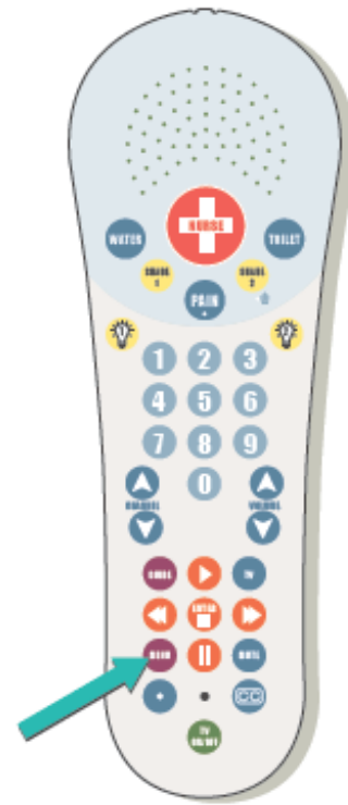
Figura 2. El botón “Menu” en su control remoto

Para responder una videollamada, presione el botón “Menu” en su control remoto (véase la figura 2). Usted verá quién llama en la TV y le escuchará a través del altavoz en el control remoto. La persona que llama también podrá verle y escucharle. Puede hablar como es habitual.