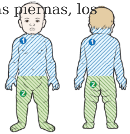
Figura 1. Use 2 toallitas si pesa menos de 22 libras (10 kilogramos)