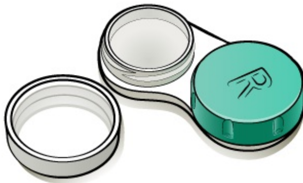
Figura 1. Estuche de lentes de contacto para soluciones multipropósito