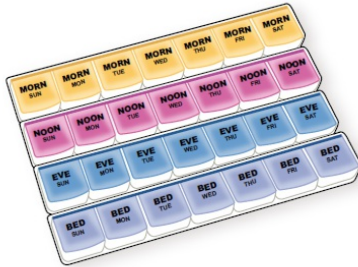
Figura 1. Ejemplo de pastillero