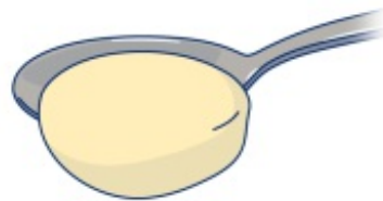
Figura 2. Prueba de inclinación de la cuchara

La comida debería deslizarse con facilidad sin que quede casi nada en la cuchara (véase la figura 2). Está bien si necesita mover suavemente la cuchara para que la comida se caiga. Su comida es demasiado espesa si se pega a la cuchara o no se cae de la cuchara inclinada.