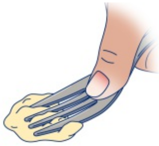
Figura 3. Prueba de presión del tenedor