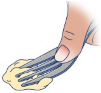
Figura 3. Prueba de presión del tenedor