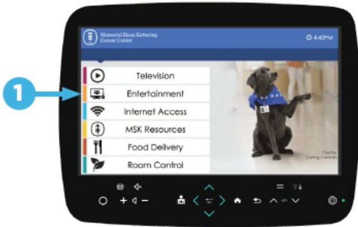
Figura 1. Selección "Entertainment" (Entretenimiento)