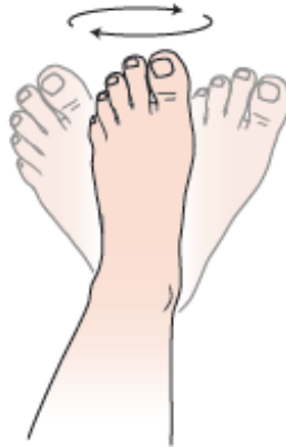
Figura 1. Círculos con los tobillos