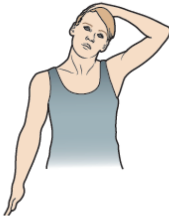
Figura 9. Estiramiento del costado del cuello