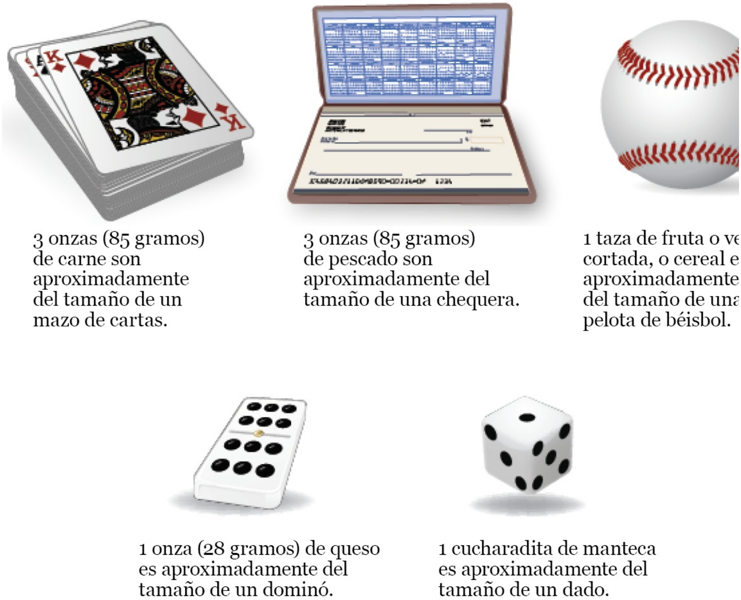
Figura 3. Ejemplos del tamaño de las porciones

Para determinar el tamaño de las porciones, use los siguientes ejemplos de objetos cotidianos (véase la figura 3):