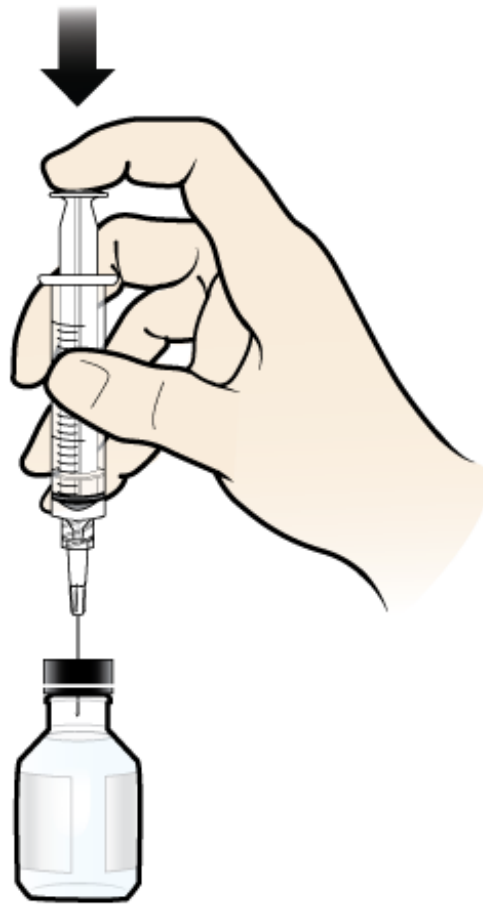
Figura 1. Inyectar aire en el frasco