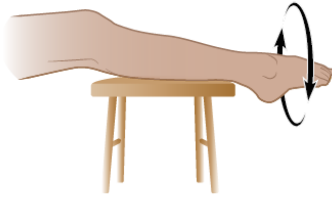
Figura 5. Círculos con los tobillos

If you have questions or concerns, contact your healthcare provider. A member of your care team will answer Monday through Friday from 9 a.m. to 5 p.m. Outside those hours, you can leave a message or talk with another MSK provider. There is always a doctor or nurse on call. If you're not sure how to reach your healthcare provider, call 212-639-2000.