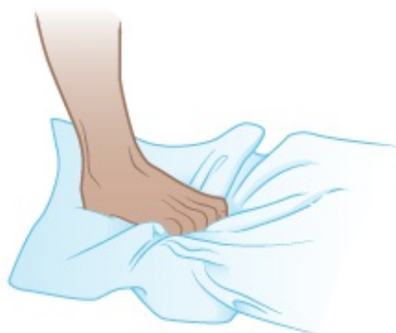
Figura 3. Flexiones de los dedos de los pies usando una toalla.