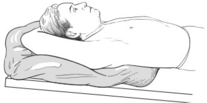
Figura 1. Posicionamiento en el molde

Probablemente estará acostado boca arriba durante la simulación. Mientras se encuentre acostado sobre la mesa, se hará un molde de la parte superior de su cuerpo. Sus radioterapeutas vertirán un líquido tibio en una bolsa de plástico grande que se sellará y se colocará sobre la mesa. Usted yacerá sobre la bolsa, boca arriba, con los