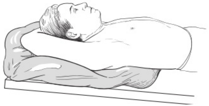
Figura 1. Posicionamiento en el molde