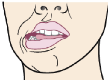
Figura 4. Mueva el maxilar a la derecha