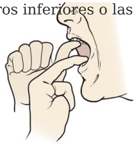
Figura 5. Ayúdese con los dedos para oponer más resistencia

Su especialista en deglución podría notar cambios en su capacidad para tragar. Si así fuera, podría enseñarle otros ejercicios u otras formas para ayudarle a tragar durante su tratamiento.