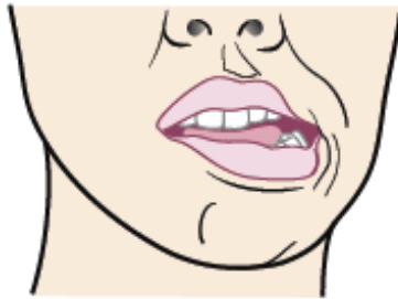
Figura 3. Mueva el maxilar a la izquierda