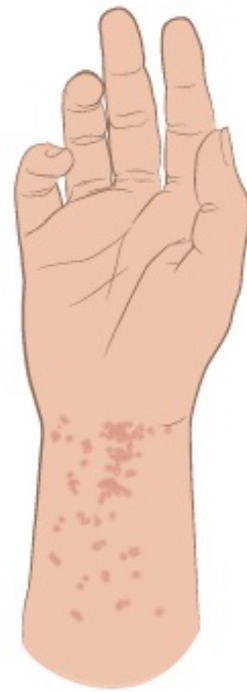
Figure 1. Sarpullido y surcos de la sarna