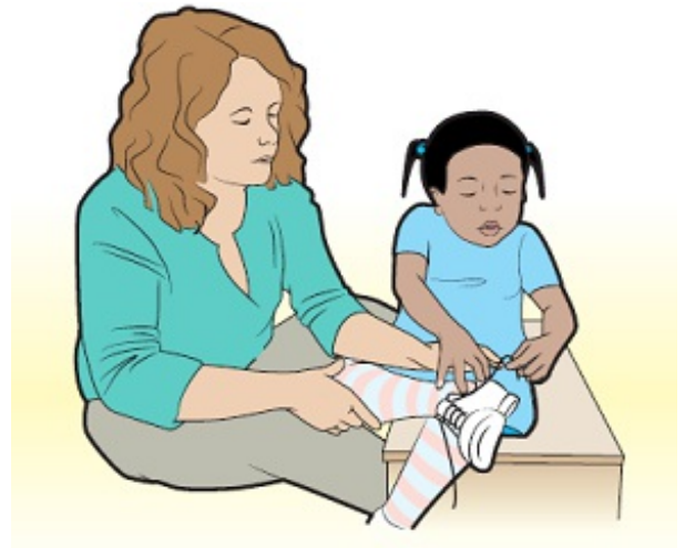
Figura 1. Trabajo con un OT