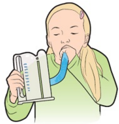
Figura 3. Uso de un espirómetro de incentivo

A veces, respirar profundamente puede ser doloroso después de la cirugía debido a las incisiones (cortes quirúrgicos) en el pecho o abdomen (vientre) del niño. Para ayudar a mejorar la respiración del niño, su enfermero y terapeuta practicarán ejercicios