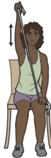
Figura 7. Tire de la banda por encima de la cabeza