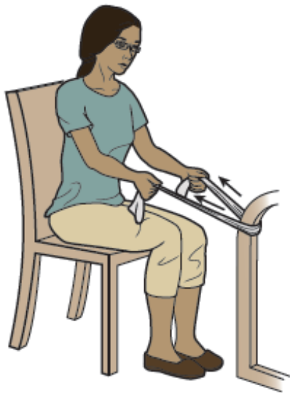
Figura 9. Pase la banda elástica alrededor de un objeto estable