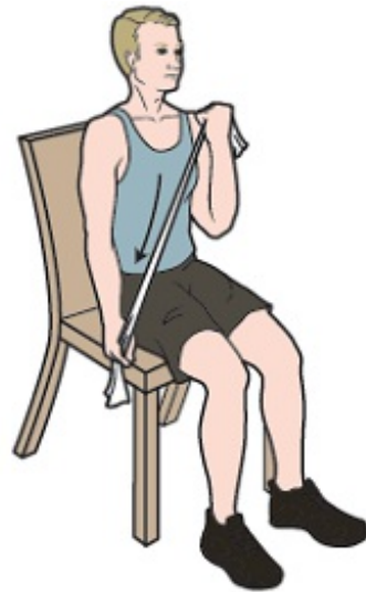
Figura 5. Estire el brazo