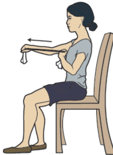
Figura 1. Golpes de puño hacia delante