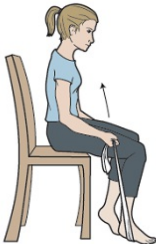
Figura 2. Colóquese la banda elástica debajo del pie.