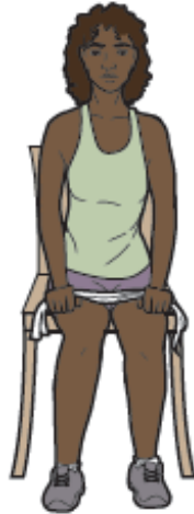
Figura 6. Sostenga la banda con los brazos a los costados