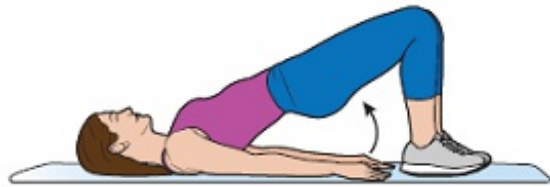
Figura 8. Levante las posaderas