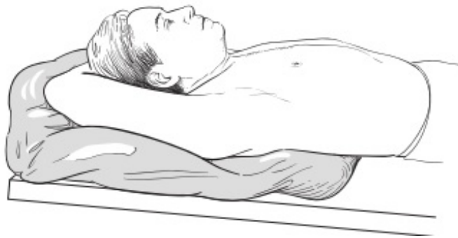
Figura 1. Un molde de cuerpo

Al principio, el líquido se sentirá caliente, pero se enfriará a medida que se endurezca. Mientras se endurece, su radioterapeuta le fijará la bolsa a la piel mediante una cinta, de modo que tome la forma de la parte superior del cuerpo y de los brazos. Eso tarda unos 15 minutos.