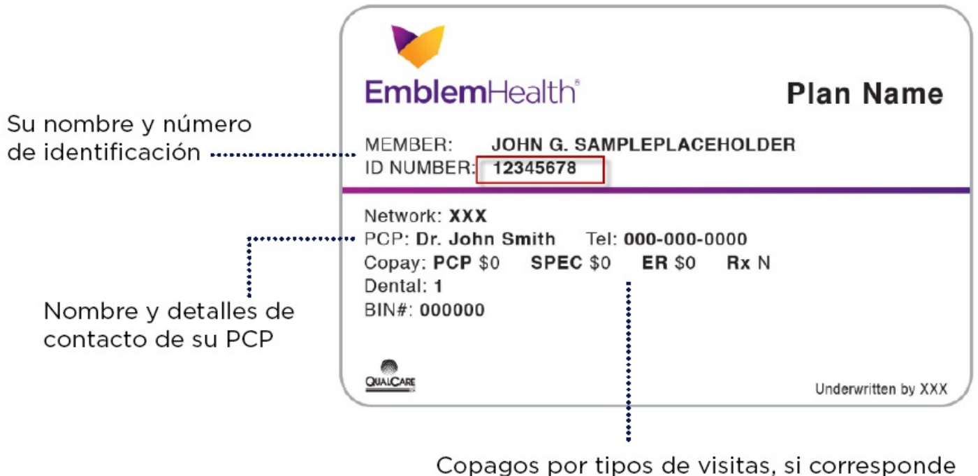
Figura 1. Información que se encuentra en el anverso de su tarjeta de seguro QHP.