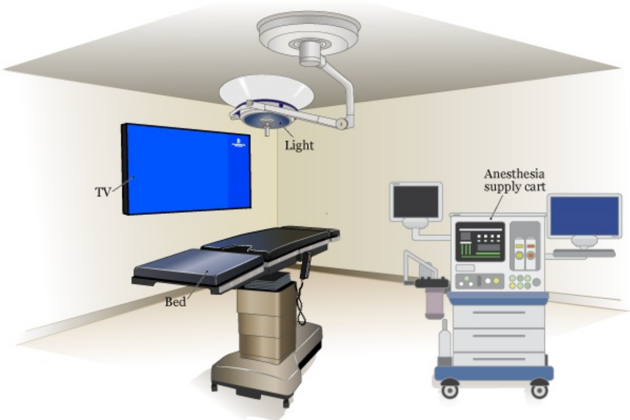
איור 1. חדר הבדיקה