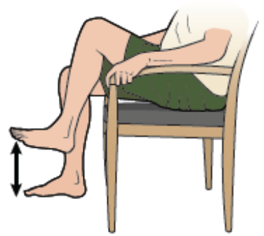
Imaj 15. Egzèsis mache sou plas