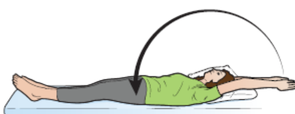
Imaj 11. Detire bra anlè tèt