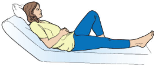
Imaj 6. Fason pou koube janm ou