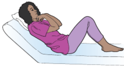
Imaj 9. Fason pou touche zepòl ou