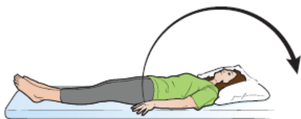
Imaj 10. Toude bra yo lonje sou kote.