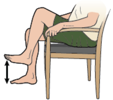
Imaj 15. Egzèsis mache sou plas