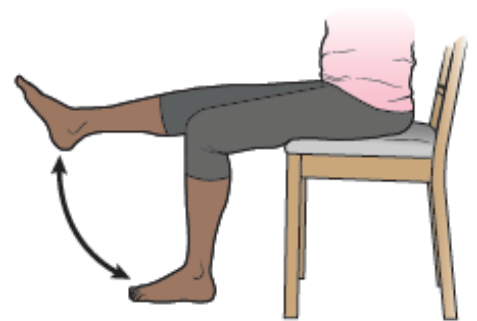
Imaj 16. Fason pou tire kout pye pandan w chita