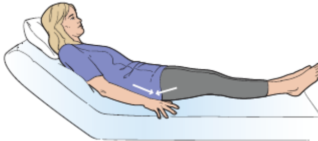
Imaj 4. Egzèsis pou ranfòse misk nan dèyè