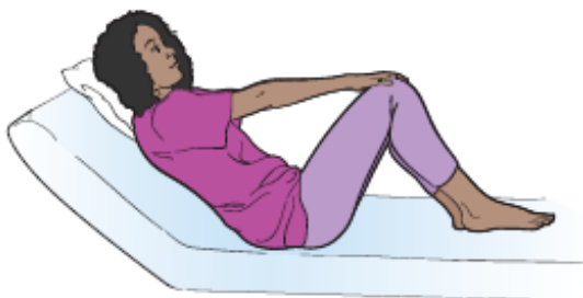
Imaj 8. Fason pou lonje bra ou