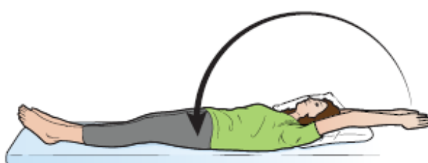
Imaj 11. Detire bra anlè tèt