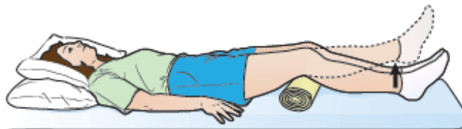
Imaj 2. Egzèsis pou misk nan pati anlè kuis