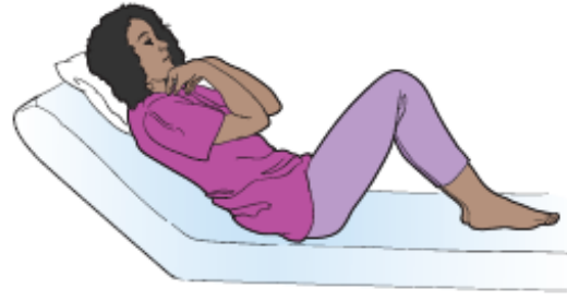
Imaj 9. Fason pou touche zepòl ou