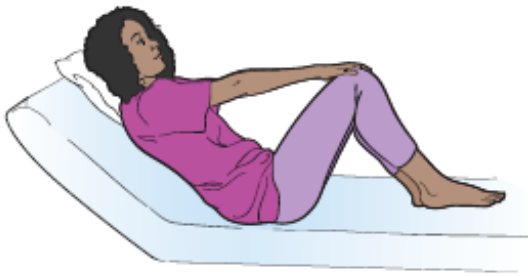
Imaj 8. Fason pou lonje bra ou