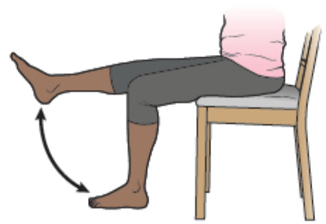
Imaj 16. Fason pou tire kout pye pandan w chita

If you have questions or concerns, contact your healthcare provider. A member of your care team will answer Monday through Friday from 9 a.m. to 5 p.m. Outside those hours, you can leave a message or talk with another MSK provider. There is always a doctor or nurse on call. If you're not sure how to reach your healthcare provider, call 212-639-2000.