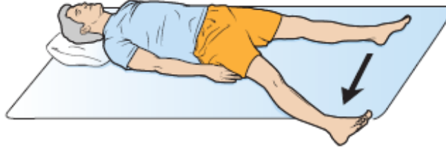
Imaj 5. Ranfòsman misk nan ranch