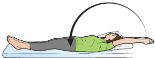
Imaj 11. Detire bra anlè tèt