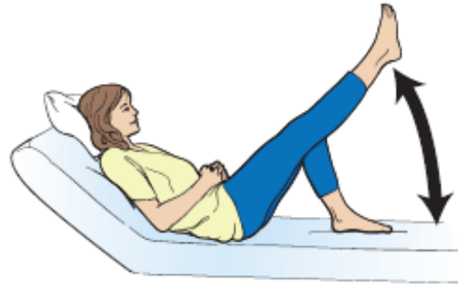
Imaj 7. Fason pou leve janm ou