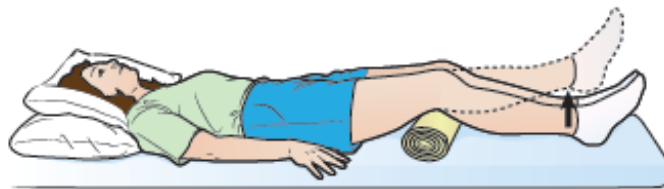
Imaj 2. Egzèsis pou misk nan pati anlè kuis