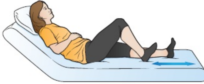
Imaj 1. Egzèsis pou janm