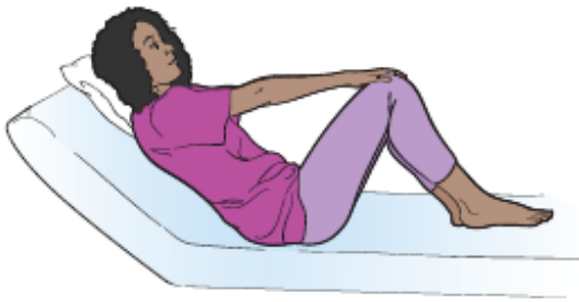
Imaj 8. Fason pou lonje bra ou