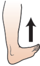
Imaj 13. Fason pou mete pwent zòtèy ou anlè