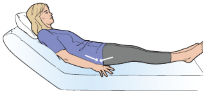
Imaj 4. Egzèsis pou ranfòse misk nan dèyè