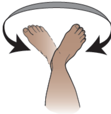
Figura 12. Cerchi con le caviglie