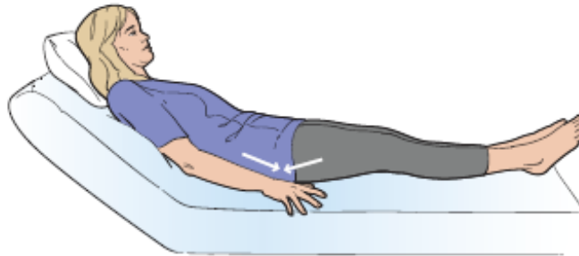
Figura 4. Serie per i glutei