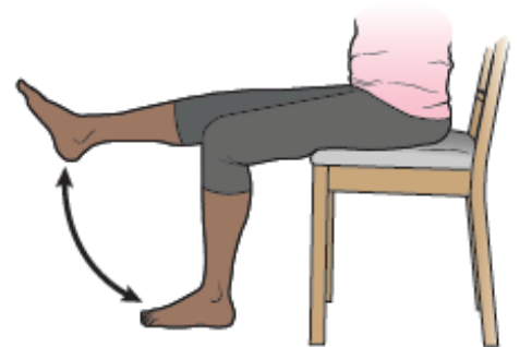
Figura 16. Calcio verso l'alto