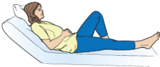
Figura 6. Piegamento della gamba