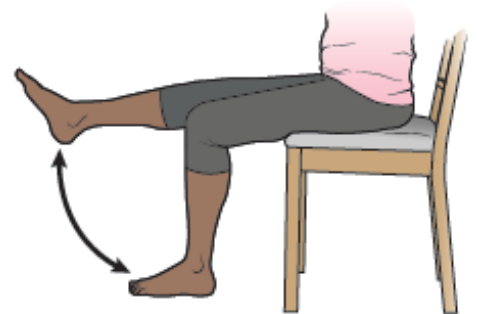
Figura 16. Calcio verso l'alto