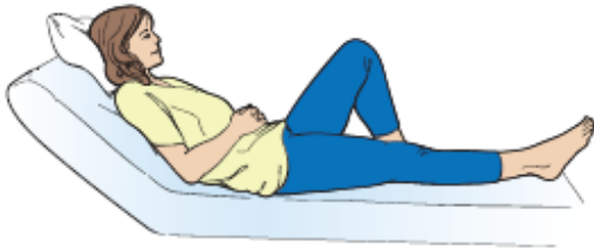
Figura 6. Piegamento della gamba