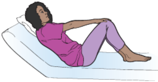
Figura 8. Allungamento delle braccia