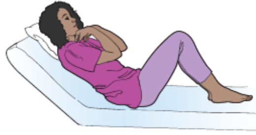
Figura 9. Tocco delle spalle