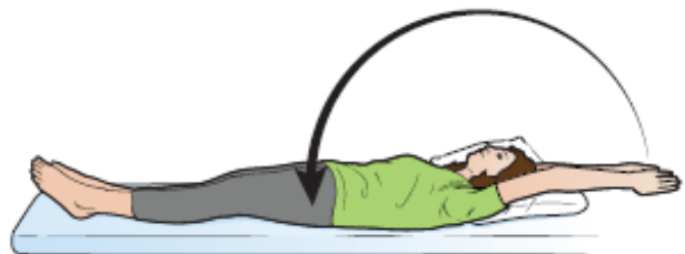
Figura 11. Allungamento delle braccia