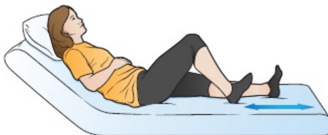
Figura 1. Scivolamento dei talloni