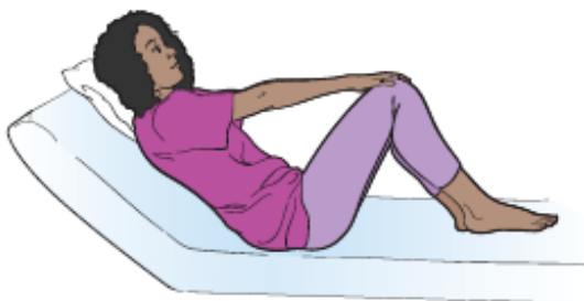
Figura 8. Allungamento delle braccia