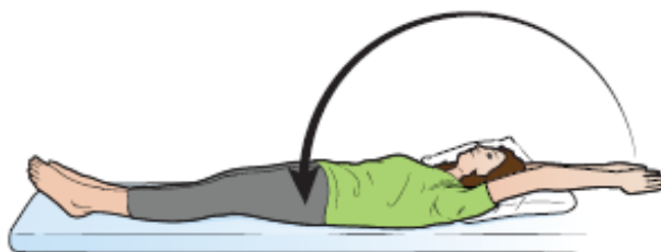
Figura 11. Allungamento delle braccia