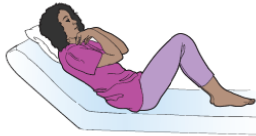
Figura 9. Tocco delle spalle