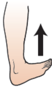
Figura 13. Dita verso l'alto