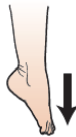
그림 14. 발가락 아래로 내리기