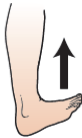
그림 13. 발가락 들어 올리기