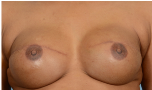
3D 문신: 양쪽 보형물 재건술