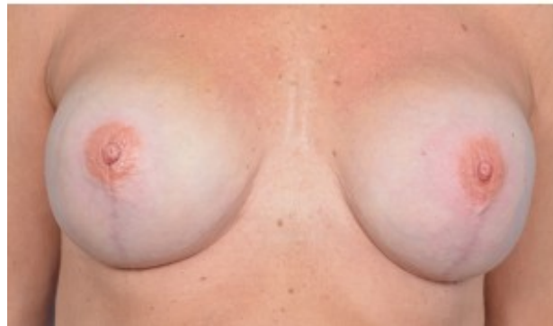
3D 문신: 양쪽 보형물 재건술

3D Tattoo Bilateral implant reconstruction