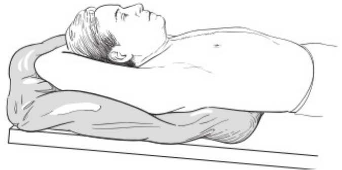
그림 1. 몰드 내 위치지정

모의치료 내내 등을 대고 누워있게 될 것입니다. 테이블에 누워 있으면 귀하의 상체에 맞게 몰드가 생성됩니다. 방사선 치료사가 따뜻한 액체를 큰 비닐봉지에 담아 밀봉한 후 테이블 위에 놓습니다. 환자는 이 비닐봉지 위에 등을 대고 눕게 되며 이때 팔은 머리 위로 올립니다(그림 1 참조). 처음에는 액체가 따뜻하게 느껴지지만 점점 단단해지면서 온도가 내려갑니다. 액체가 굳는 동안 치료사가 테이블을 이용해 비닐봉지를 환자의 피부에 붙여 환자의 상체와 팔 모양에 맞춰 형태를 잡습니다. 이 과정은 15분 정도 걸립니다.