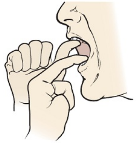
그림 5. 손가락을 사용해 저항 늘리기

치료 팀이 치료 중에 무엇을 먹고 마셔야 하는지에 대해 말씀해 드릴 것입니다. 연하 전문가가 적합한 음식과 액체를 추천해 드릴 것입니다. 새로운 음식과 액체를 드시는 경우 연하 전문가가 추천한 질감인지 확인하십시오.