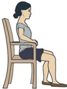
그림 9. 등을 똑바로 세운 자세로 앉습니다.