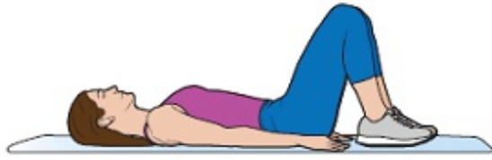
그림 7. 무릎을 구부린 채로 똑바로 눕습니다.