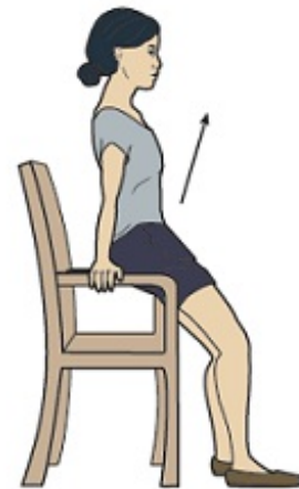
그림 10. 팔걸이를 사용해서 의자에서 몸을 들어 올립니다.