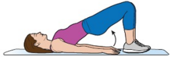
그림 8. 엉덩이 들어 올리기