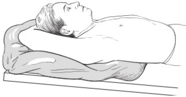
그림 1. 신체 몰드

처음에는 액체가 따뜻하게 느껴지지만 점점 단단해지면서 온도가 내려갑니다. 액체가 굳는 동안 방사선 치료사가 테이프를 이용해 비닐봉지를 환자의 피부에 붙여 환자의 상체와 팔 모양에 맞춰 형태를 잡습니다. 이 과정은 15분 정도 걸립니다.