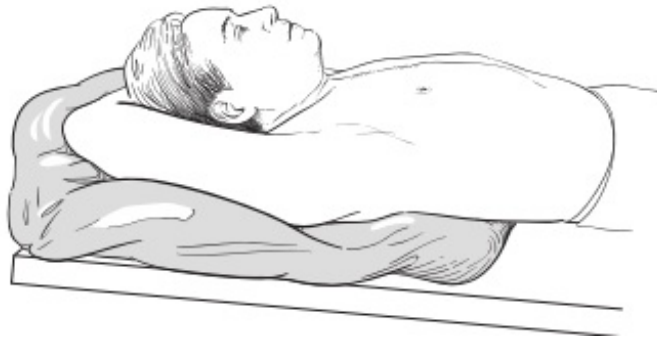
그림 1. 신체 몰드

처음에는 액체가 따뜻하게 느껴지지만 점점 단단해지면서 온도가 내려갑니다. 액체가 굳는 동안 방사선 치료사가 테이프를 이용해 비닐봉지를 환자의 피부에 붙여 환자의 상체와 팔 모양에 맞춰 형태를 잡습니다. 이 과정은 15분 정도 걸립니다.