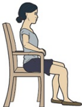
Rysunek 9. Siedzenie z wyprostowanymi plecami