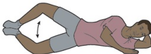
Rysunek 11. Małże

If you have questions or concerns, contact your healthcare provider. A member of your care team will answer Monday through Friday from 9 a.m. to 5 p.m. Outside those hours, you can leave a message or talk with another MSK provider. There is always a doctor or nurse on call. If you're not sure how to reach your healthcare provider, call 212-639-2000.