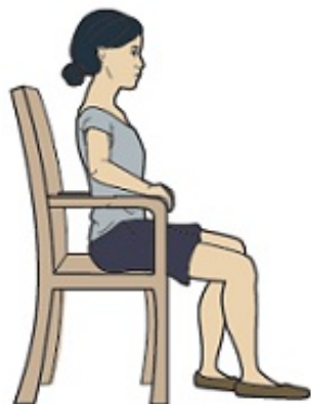
Rysunek 9. Siedzenie z wyprostowanymi plecami