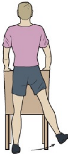
Rysunek 1. Odwodzenie nogi w bok w pozycji stojącej