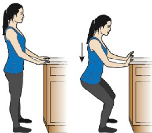
Rysunek 3. Przysiady