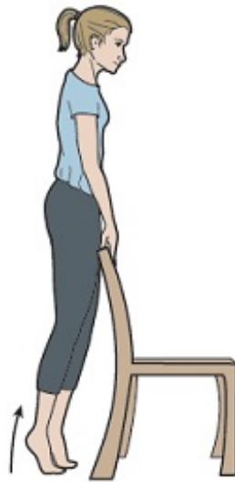
Rysunek 6. Unoszenie pięt