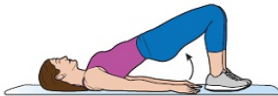
Rysunek 8. Unoszenie pośladków