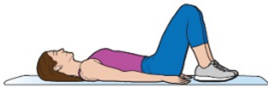
Rysunek 7. Leżenie na plecach ze zgiętymi kolanami