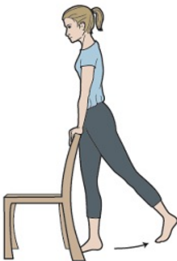
Rysunek 2. Odwodzenie nogi w tył w pozycji stojącej