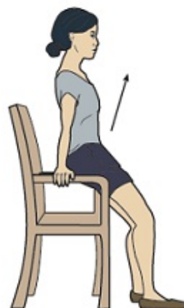
Rysunek 10. Podnoszenie się z krzesła za pomocą podłokietników